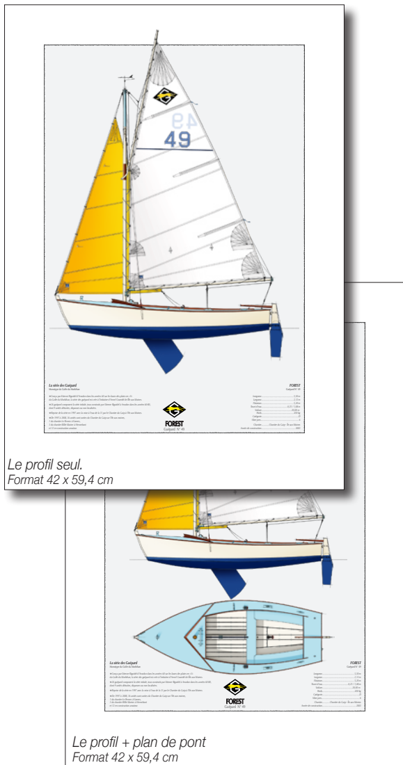
Le profil seul. Format 42 x 59,4 cm

Pour conserver la confidentialité de ce travail j'ai choisi de limiter le tirage à 8 exemplaires identiques, numérotés et signés dont les numéros 1 et 2 vous seront réservés dans le cadre de votre commande.